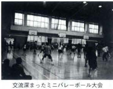
交流深まったミニバレーボール大会

◆熱い話し合い。この情熱こそが「地域の宝」を呼び起こし、導くパワー。夢ある未来を創造していこう!