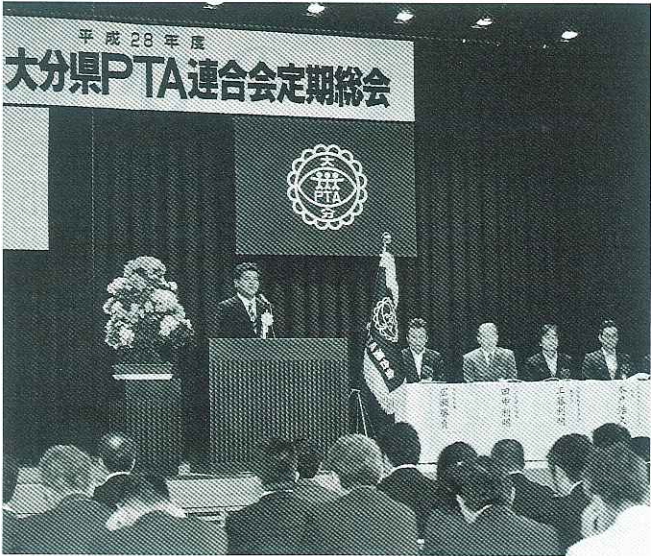
子どもたちが輝くためのPTA活動を呼びかける