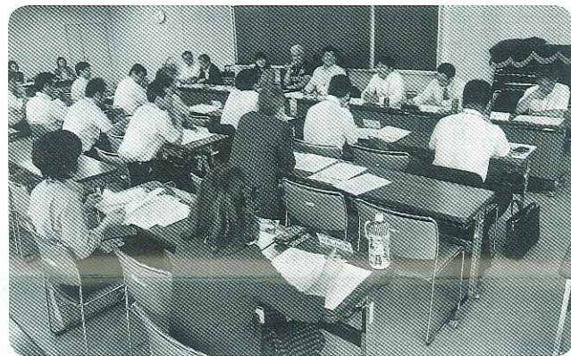
県内16郡市の代表らで熱く協議

学校教育部会では、7月30日に行う単P会長研修会について話し合いを進めた。今年度は、P会長として具体的に役立つ研修資料を作成し研修内容の充実を図る。家庭教育部会では、指定研究発表校の審査方法などについて話し合われた。