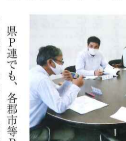
各郡市等P連を代表して集う県P連理事たち

グループ討議では、規模別に小学校と中学校をグループに分け、意見交換や情報収集が行われる。会長同士、交流を通じて各単Pの活動の見直しや問題解決の糸口をつかむ機会になっており、どう考え動くのか、会長としてのあり方を考える場になっている。