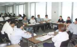
昨年のグループ討議の様子

グループ討議では、規模別に小学校と中学校をグループに分け、意見交換や情報収集が行われる。会長同士、交流を通じて各単Pの活動の見直しや問題解決の糸口をつかむ機会になっており、どう考え動くのか、会長としてのあり方を考える場になっている。