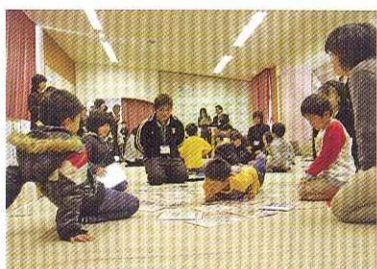
カルタで郷土を身近に

午前中の公開活動では、低学年・中学年・高学年に分かれ、それぞれテーマに沿った活動を紹介した。