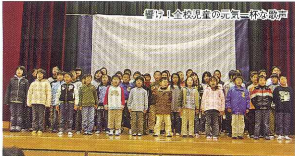
響け! 全校児童の元気一杯な歌声