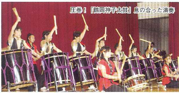
圧巻! 『鶴岡神子太鼓』 息の合った演奏