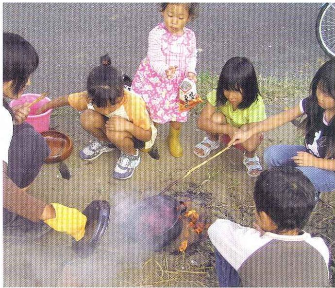
レクリエーションで心のふれ合い

情報化社会の今、子育ても多様な価値観が生まれている。子どもをとりまく環境が急激に変化し、子どもらしさが見えにくくなっているが、従来の子育てで観では難しいのだろうか。子どもへの接し方が問われている現状の中、今回は一人ひとりの子どもを見つめた家庭での取り組みを追った。