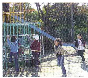
守りたい子どもの笑顔

所などのルールを作ることにし、条件付で息子にゲームを与えることにした。けれど、何度かルールを破るので、再度約束を守るための大切さを話し合った。最近では、友だちの話をよくするようにになり、表情も明るくなってきた。今、ゲームを通して、我慢をすることの大切さも学んでいるようだが、ゲームが与える影響も心配だ」と語った。