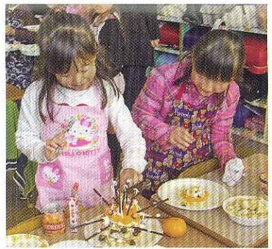
ホットケーキがすてきに変身

平成19・20年度の2年間にわたり県PTA指定研究に取り組んできた3校のPTAが、それぞれの公開発表を行った。子どもたちが活動の中心にいる、あたたかさの感じられる発表となった。今回の指導講評は、2校とも多田千栄県教育庁生涯学習課社会教育主事が行った。(大分市立城南中学校PTAの発表は、日程の関係で次号に掲載します)